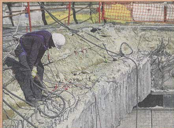
Pour les métiers du bâtiment, en attendant les référentiels de branche, la pénibilité va être un vrai casse-tête.

Tous ces points s'accumulent et permettent aux salariés de bénéficier d'une réduction du temps de travail, d'une retraite anticipée ou encore d'une formation. Le barème est assez simple. Avec deux points, on peut suivre 50 heures de formation. Avec 10 points, on peut anticiper d'un trimestre sa retraite (deux ans maximum). Avec 10 points toujours, on peut travailler à mi-temps durant un trimestre sans perte de salaire (deux ans maximum aussi). Pour ceux qui sont nés après 1962, les vingt premiers points sont réservés à la formation. Les salariés seront informés annuellement de leur décompte de points et ils pourront également le consulter sur Internet.